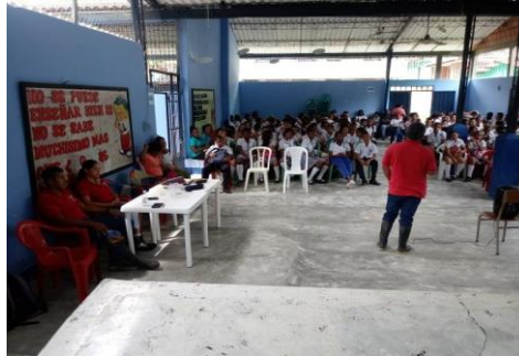
Actividades día del medio ambiente