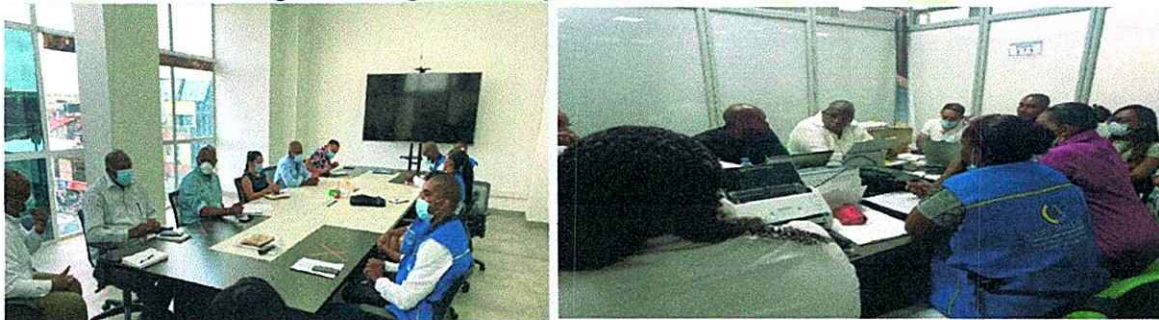
Registro fotográfico – Apertura Alcaldía de Quibdó