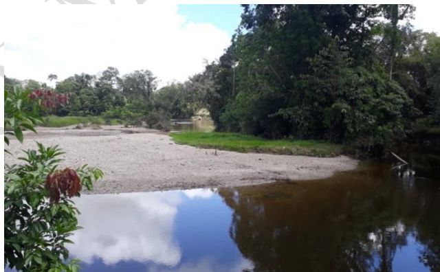
Sitios recuperados por actividad minera

Esta actividad es desarrollada con la utilización de maquinaria pesada “retroexcavadora”, según PLAN DE GESTION MUNICIPAL DESDE LA PERSPECTIVA DE LA EDUCACION AMBIENTAL DEL MUNICIPIO DE ATRATO, 2016, las cuales de forma indiscriminada generan apertura de claros al bosque por la implementación de carreteras, pérdida de cohesión del macizo rocoso, vertimientos de aguas residuales a fuentes hídricas, migración de fauna. En términos generales el suelo y el recurso hídrico en el municipio de Atrato se encuentra impactado principalmente por la minería mecanizada. Según estudios realizados, las zonas donde se ha desarrollado la minería mecanizada en el municipio de Atrato han sido abandonadas son que se hubiese implementado alguna medida para prevenir, compensar o recuperar la devastación generada.