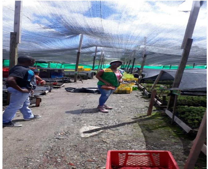
Recuperación de áreas afectadas – vivero de achiote