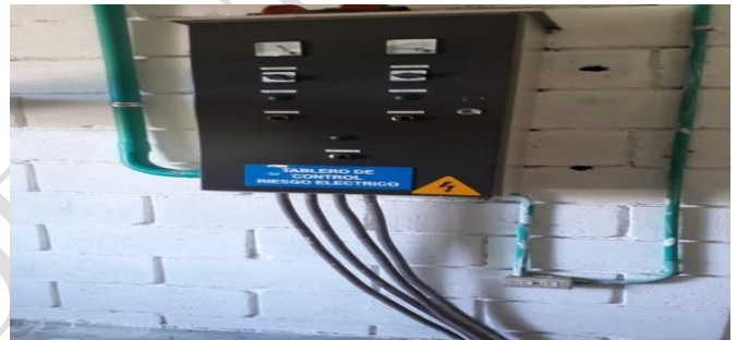
Bocatoma – tablero de control