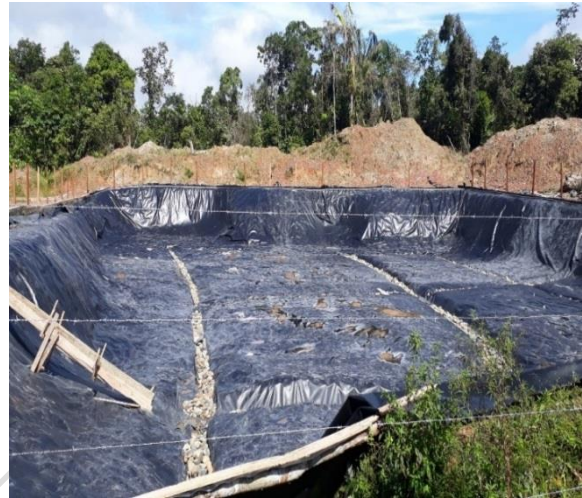
Botadero a cielo abierto