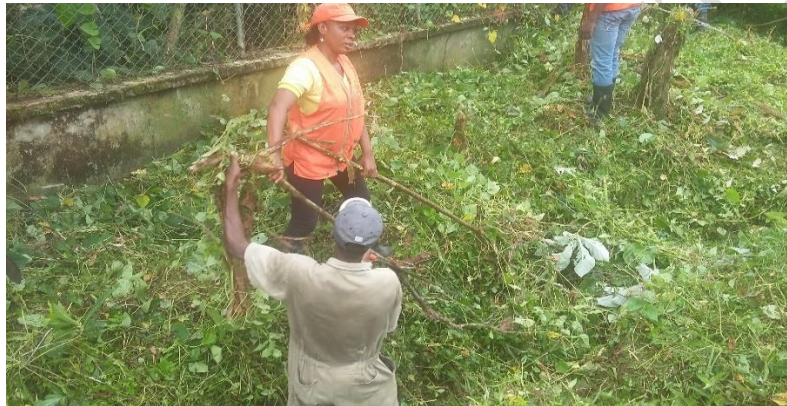
Tabla N° 33 Areas degradadas